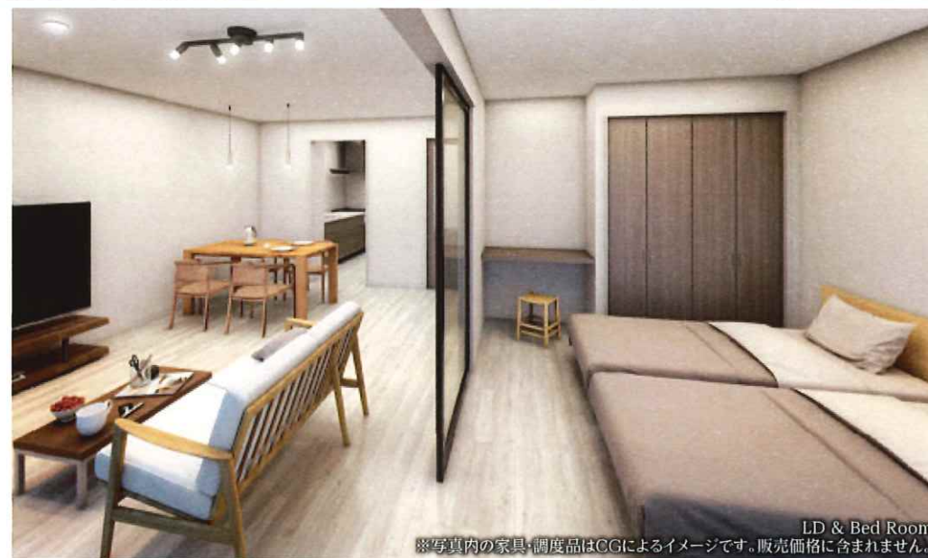
LD & Bed Room ※写真内の家具・調度品はCGIによるイメージです。販売価格に含まれません。